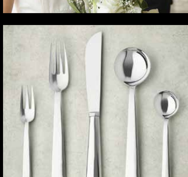
Entwurf von Josef Hoffmann