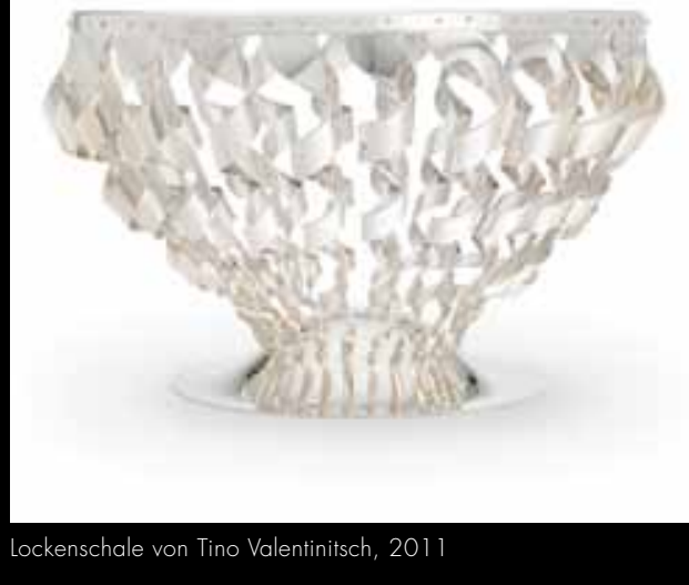
Lockenschale von Tino Valentinitisch, 2011