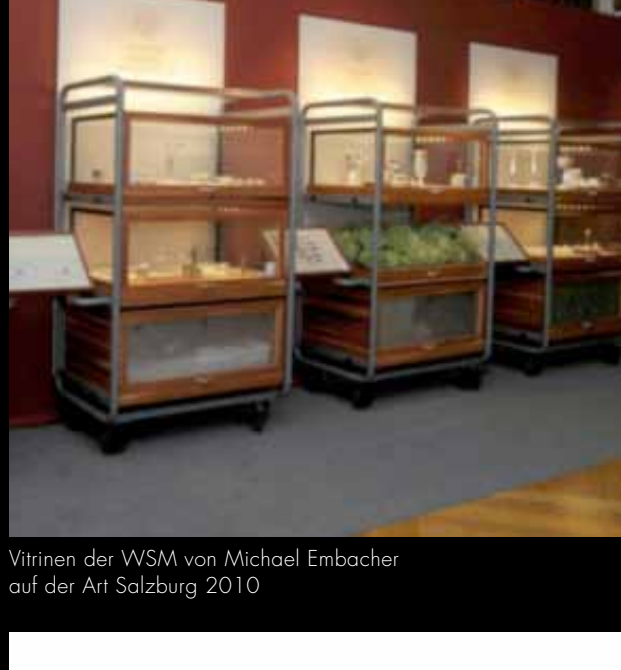
Vitrinen der WSM von Michael Embacher auf der Art Salzburg 2010